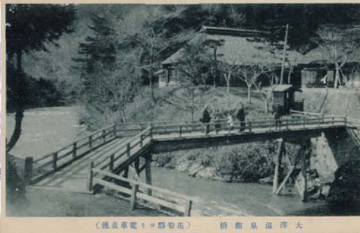
豊沢川にかかる曲橋

その光太郎を癒していたのは花巻各所に存在する山の出湯、「温泉」でした。この企画展では光太郎にゆかりある数々の湯を当時の絵はがきや資料でたどります。