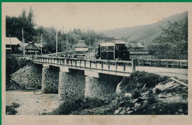
渡り橋を進む花巻電鉄